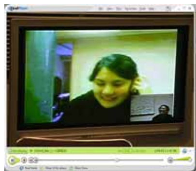
オンライン・ランゲージ・エクスチェンジの様子

活動は4週間と短い期間でしたが、語学学習の言語面においても効果は見受けられました。セッションに4回参加した4名の日本人学生に対して行ったセッション参加前と後のオーラル・インタビューのデータを比較した結果、測定した流暢さ (fluency)、正確さ (grammatical accuracy)、複雑さ (lexical and syntactic complexity) において全て統計的有意な結果となりました。