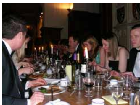
Formal Hall at Pembroke Collage

来年の夏に行われるケンブリッジ大学の学位授与式に出席する予定です。久々の仲間との再会、歴史あるコレッジめぐり、図書館や植物園の訪問、ケム川でのパンティング…、遠い昔のお伽話のようにさえ思えるあの美しい街に再び訪れることができるのが、今からとても楽しみです。