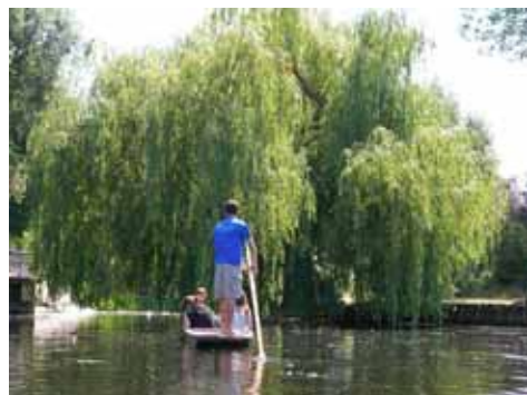
Punting at Cam River